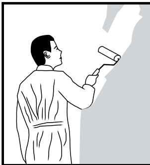
PAINT over Plaster-Grip Primer.