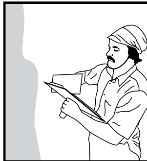
PLASTER over Plaster-Grip Primer. PLEISTER oor Plaster-Grip Primer.