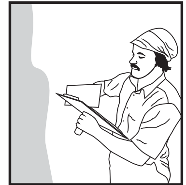
PLEISTER OF PLAAS DEKVLOER oor Plaster-Grip Grondlaag. PLASTER OR SCREED over Plaster-Grip Primer.