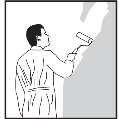
PAINT over Plaster-Grip Primer. VERF oor Plaster-Grip Grondlaag.

NON HAZARDOUS Keep out of reach of children.